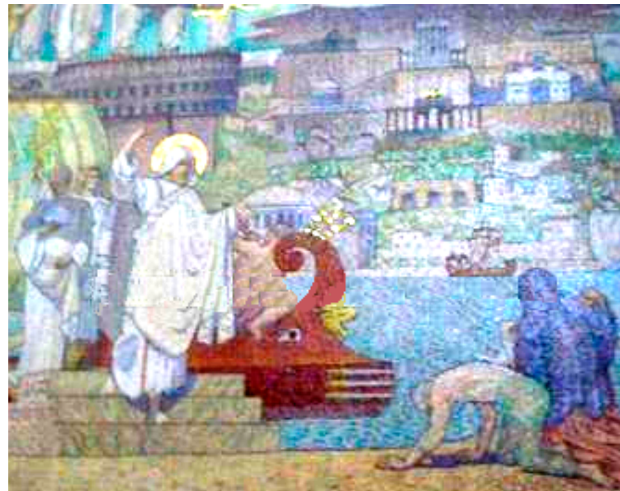
Illustration en 1 er page : Saint Pothin (†177), prédécesseur d'Irénée, arrive à Lyon et apporte la foi depuis l'Orient. D'après une mosaïque de la basilique de Fourvière composée par Charles Lameire en 1910.

L'ASSOCIATION MIGNE ET LE COURS NOS RACINES SONT HEUREUX DE VOUS PROPOSER